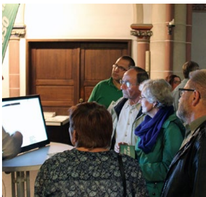
Präsentation des Blogs