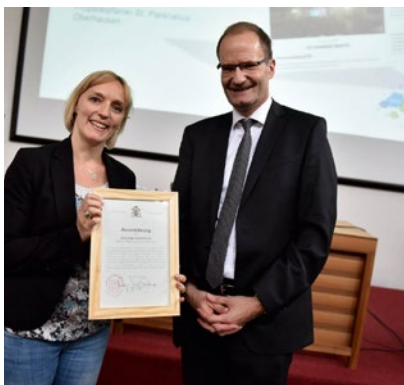
Blog gewinnt Innovationspreis