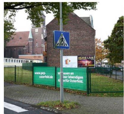
Planen bei St. Antonius