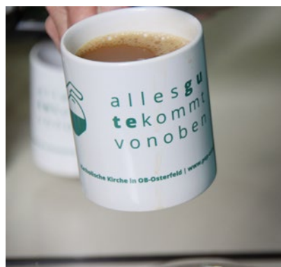
Tasse zum Visionstag