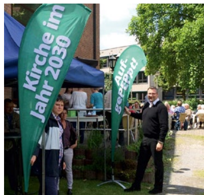
Stand auf Gemeindefest