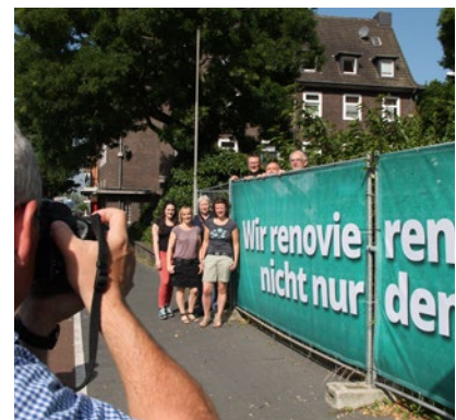
Planen Bauzaun St. Pankratius