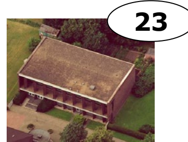
St. Judas Thadäus