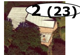
Weitere Kirche: Schul- und Sozialkirche St. Jakobus

Dargestellt sind die sog. Ewigkeitskosten: Der entsprechende Betrag müsste jedes Jahr für die Bauunterhaltung zurückgelegt werden, wenn die Kirche auf unbestimmte Zeit erhalten bleiben soll.